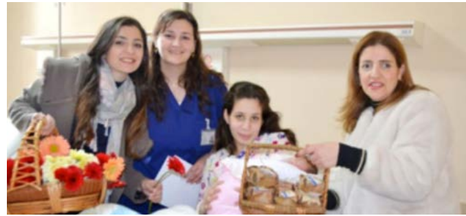
المستشفى ووزع المناشف للمرضى.

وذلك على مدة أسبوع كامل، في قاعة «الشهيد ميشال حنا اسكندر» للمحاضرات، وشارك في التدريب الموظفون، الإداريون، الأطباء والطاقم التمريضي. وعرض السيد موسى خلال الأسبوع الكامل: مسببات الحريق، مثلث النار والإطفاء، الحماية من الدخان، أنواع الحرائق ووسائل الإطفاء «المطافئ الكيميائية»، كيفية التصرف في حال حدوث حريق وخطة الإخلاء.